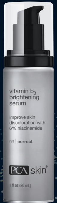
Vitamin b 3 Brightening Serum