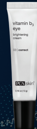
Vitamin b 3 Eye Brightening Cream